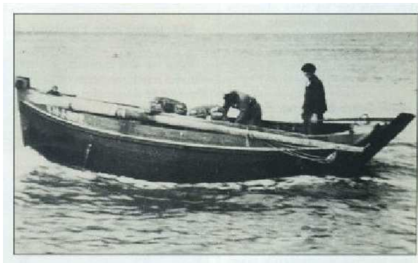
L'Angélus en pêche

La pêche - En 1949 Georges Néel prend sa retraite « proportionnelle » et se met à la pêche. Il pratiquera deux métiers : du printemps à l'automne il pratique la petite pêche sur l'Angélus et en hiver il est matelot sur l'Hélène Jacqueline à Gaston Loudières qui pratique la corde aux Casquets.