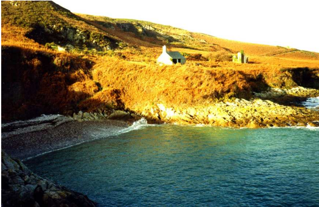
La maison des Néel et, au premier plan, le « r'hâble à Néel » où était mouillé le canot.